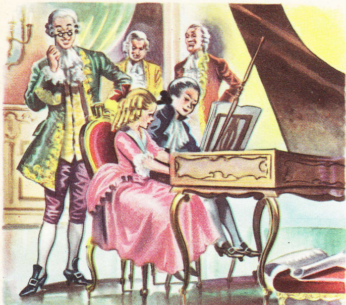
Agé de sept ans, Wolfgang Amédée Mozart, exécute, avec sa petite soeur, une sonate au clavecin.