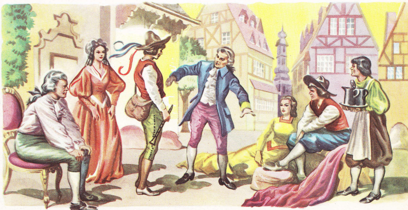
En écrivant la « Flûte enchantée » Mozart a pu se souvenir de la légende du joueur de flûte de Hameln.