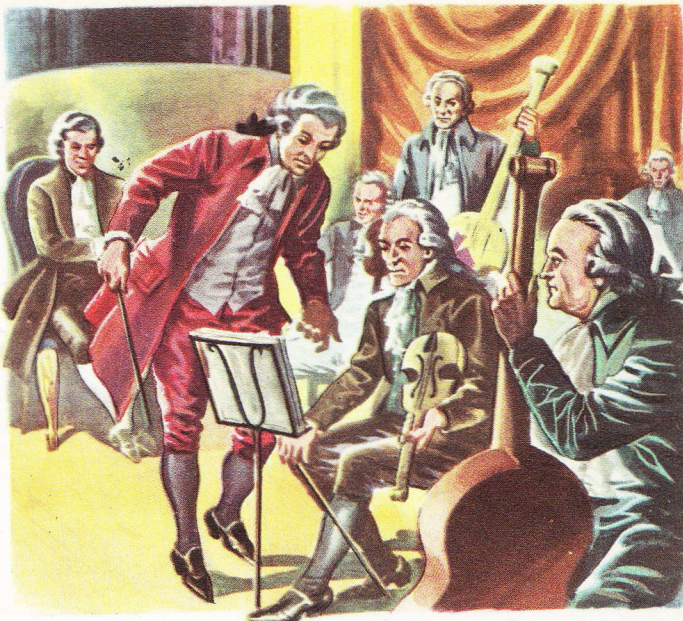
Mozart dirigeant les répétitions d'un de ses opéras.

Sa dernière oeuvre est le célèbre Requiem où passe tant de nostalgie d'un monde qu'il allait bientôt quitter, mais où l'on sent aussi l'aspiration à un monde plus élevé, où les âmes comme la sienne trouveraient enfin plus d'êtres dignes et capables de les comprendre et de les aimer.