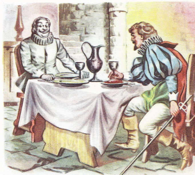
Une scène de Don Juan, l'opéra où la puissance dramatique de Mozart éclate avec le plus d'intensité.